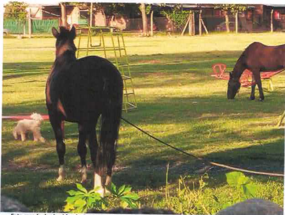
Foto sacada desde el fondo de nuestras casas. Lo que se observa en la parte inferior de la imagen es la pirca de uno de nuestros patios.