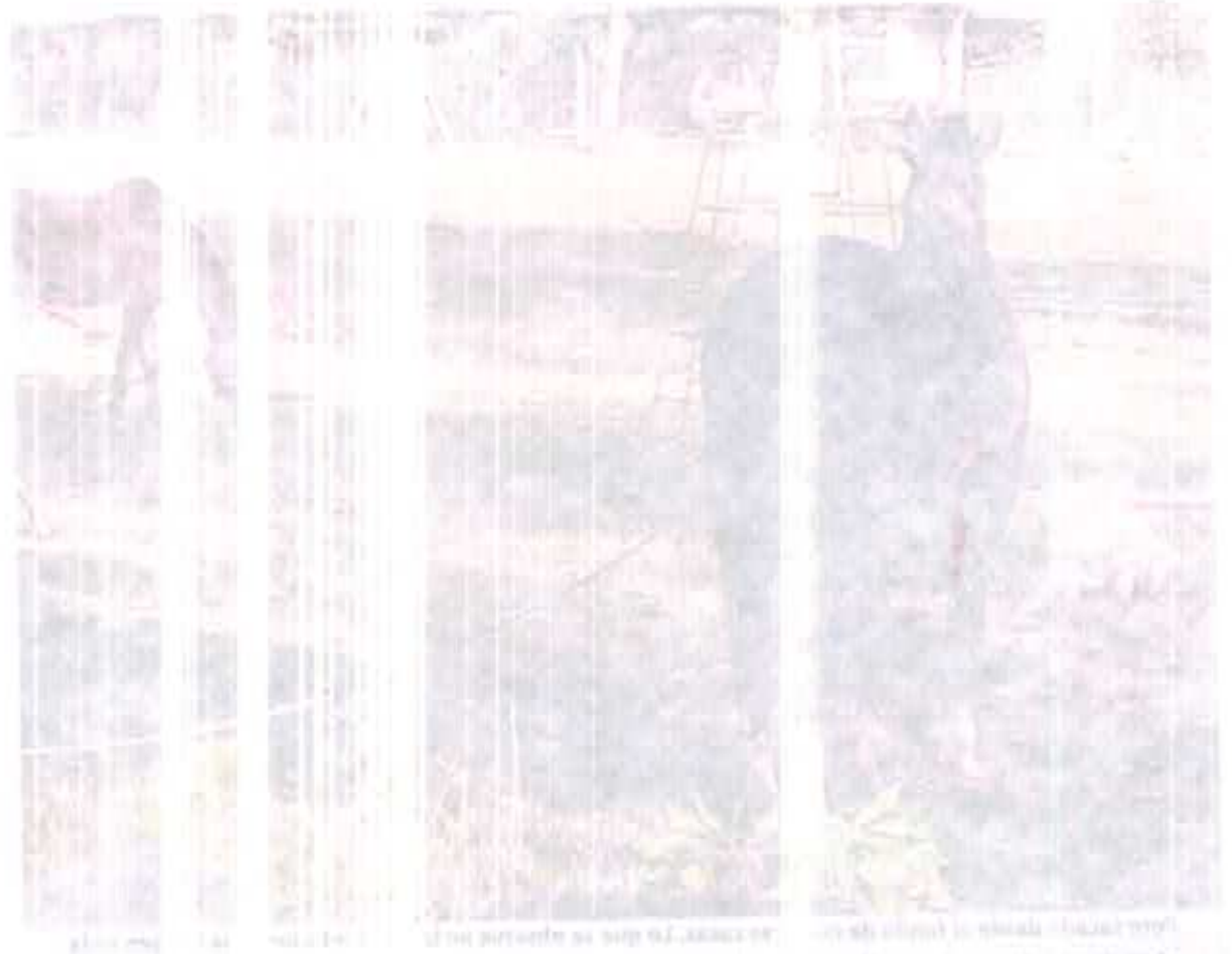
1. The first