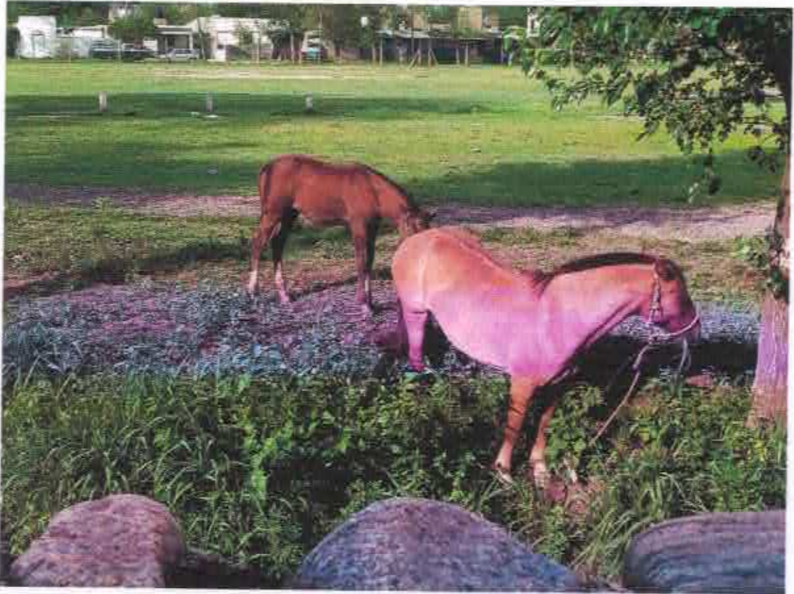
Foto sacada desde el fondo de nuestras casas. Lo que se observa en la parte inferior de la imagen es la pirca de uno de nuestros patios.